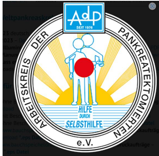
Das Angebot ist für Teilnehmer kostenfrei

Zoom-link bis 29.10.2024 10:00Uhr unter uwebuchsteiner@hotmail.de oder 01715176730 erfragen.